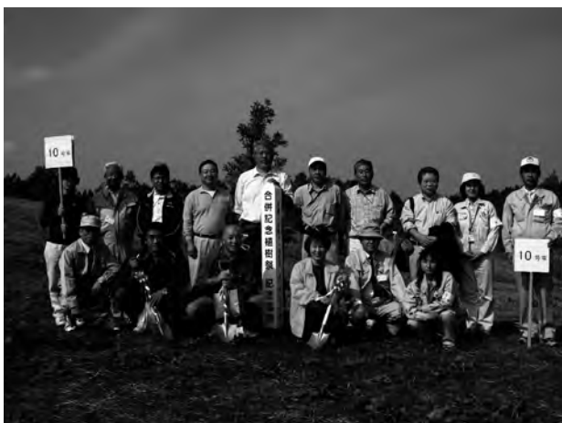
野津原町今市での合併記念植樹祭にて

日本も世界も何か得体の知れない不安感の漂う雰囲気をもっています。地域住民が共同体としての連帯感、心のつながり感を強固にしていくことこそが、その悪魔のような不安感を拭い去る唯一の、そして最も確実な方法だと考えています。