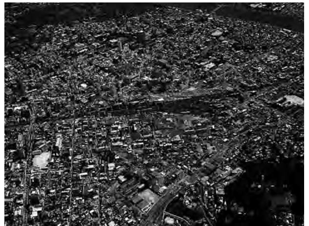
大分駅周辺航空写真

大分駅高架に伴う周辺地域の整備、生活道路の整備と保全、中小零細企業支援、新しい農水産業の社会的存在価値の創出などを視野に入れて活動していきます。