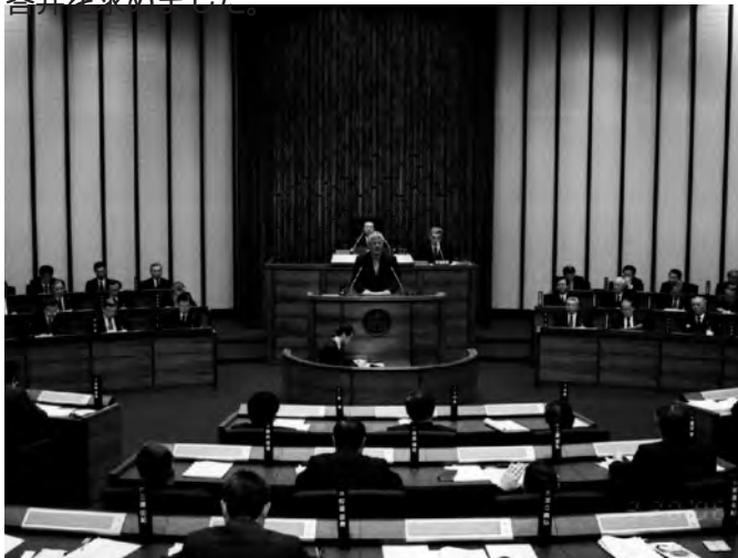
本会議での質問風景

わたしは 3 月 20 日午後一般質問に立ち、提案を含めて予算案件についてなど 9 項目 14 点について執行部の答弁を求めました。