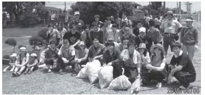
旭化成グループ労組の皆さんとゴミ拾いボランティアをしながら、道路の問題点などを見て回っています。

道路・橋梁の持つ危険性、上水道の持つ危険性、下水道の持つ危険性にはそれぞれの特性があり、それぞれに緊急性の高い行政課題です。