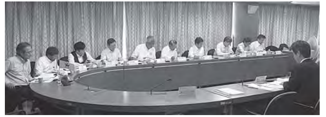
荒川区役所で区民幸福度事業について説明を受けました。