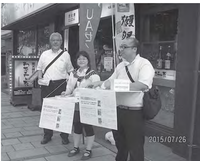
拉致被害者の早期救出のための街頭活動に参加しました。

その他、シルバー人材センターの社会福祉協議会への統合、生活困窮者自立支援事業について質問しました。