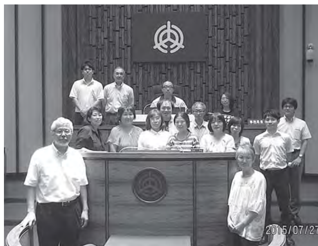
イオングループ労連の仲間の皆さんと実際に本会議場を使って模擬議会を行いました。